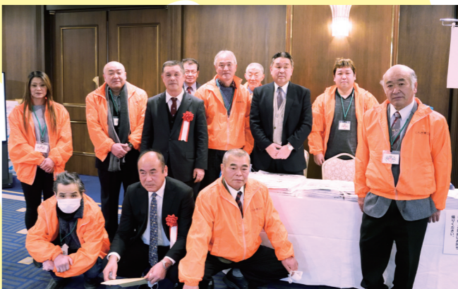
栃木県支部の皆様

参加者の皆様には各地遠方からもおいでいただき、ありがとうございます。昨年は天候の問題で地域によっては高温障害もあったと聞いています。しかしシタケはいい産業なので十年に一回程度の天候には負けずに続けてください。 サンマッシュの生産者同士の交流をすることでどんどんレベルを上げていくのが楽しみです。私たちの地元、北研にもどんどん電話して利用してもらいたいと思います。