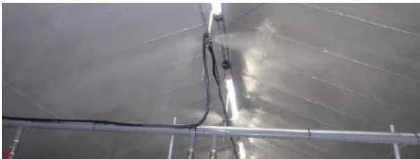
細霧噴霧（空調補助・保湿）