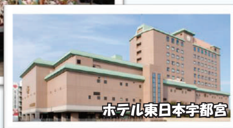
ホテル東日本宇都宮