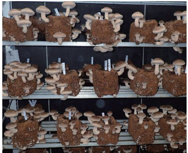
715号廃菌床再利用培地での発生