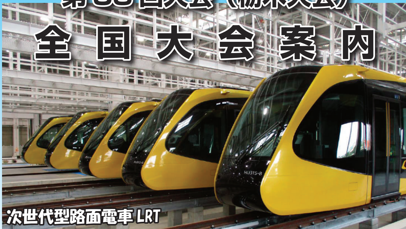
次世代型路面電車 LRT