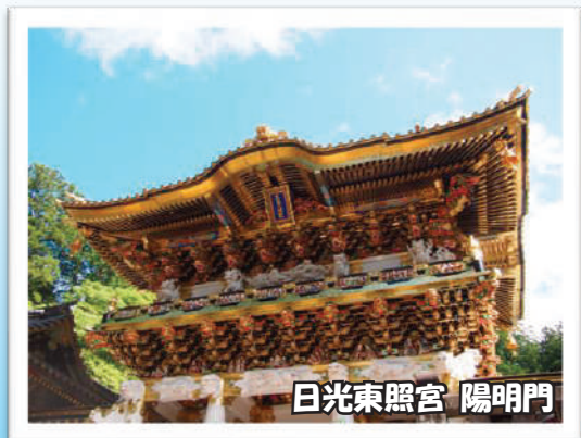
日光東照宮 陽明門