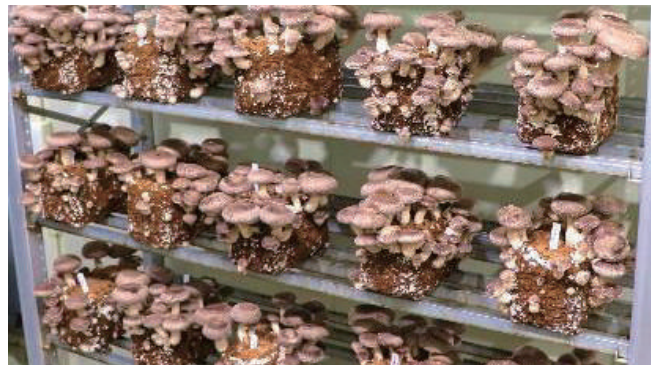
空調全面栽培用新品種

来春に試験発売を予定している901号・902号の改良版にあたる空調全面栽培用新品種について栽培特性と推奨栽培条件を提示します。また、現在開発中の品種についても紹介します。