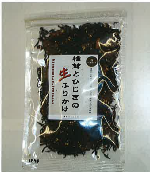
椎茸とひじきの生ふりかけ

「醤油の匠」と「きのこの匠」のコラボ商品！ 香り豊かなつゆは、めんつゆとしてはもちろん、きのこパスタ、煮物、鍋等、いろいろな料理にご利用いただけます。