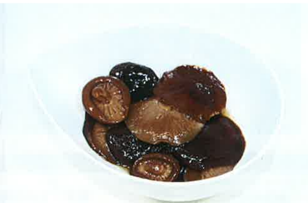
匠のしいたけ山椒煮