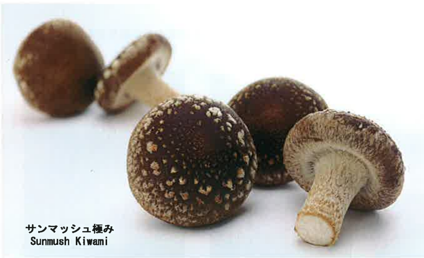
サンマッシュ極み Sunmush Kiwami

収穫から48時間以内に店頭と並べる物流システムによる、高鮮度の最高級菌床椎茸。 驚きのサイズと肉厚で、歯ごたえの良い食感をご堪能ください。