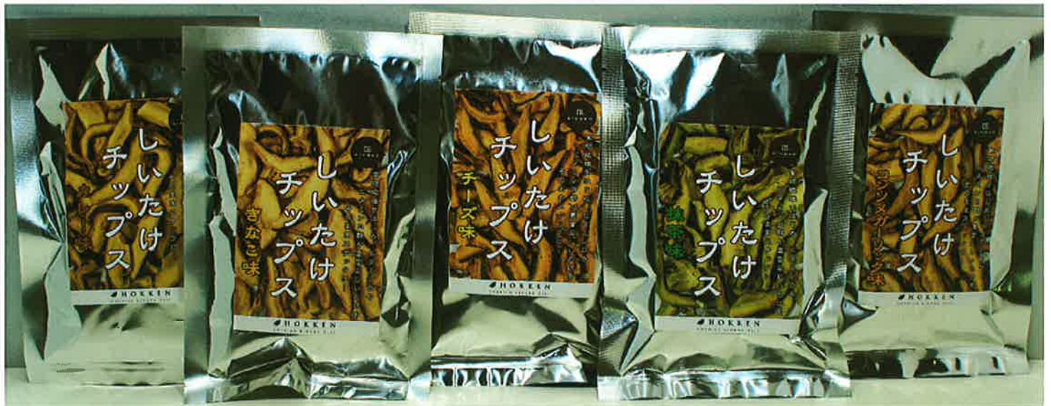
しいたけチップス (5種)