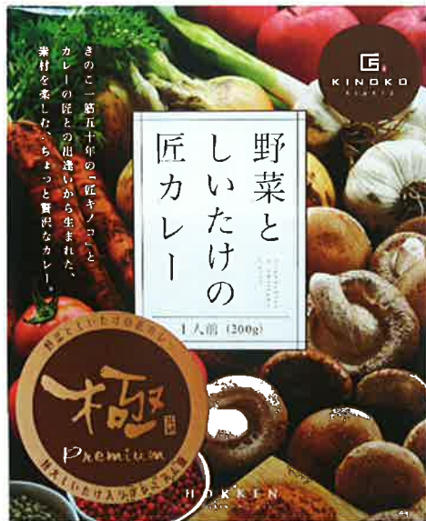
ジャンボシイタケ入極みカレー