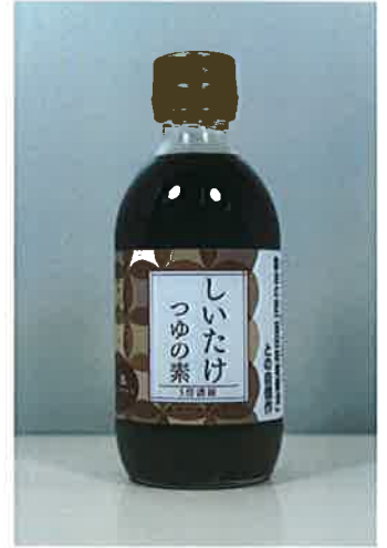
しいたけつゆの素

「醤油の匠」と「きのこの匠」のコラボ商品！ 香り豊かなつゆは、めんつゆとしてはもちろん、きのこパスタ、煮物、鍋等、いろいろな料理にご利用いただけます。