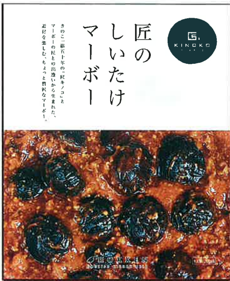
匠のしいたけマーボー (新発売!)