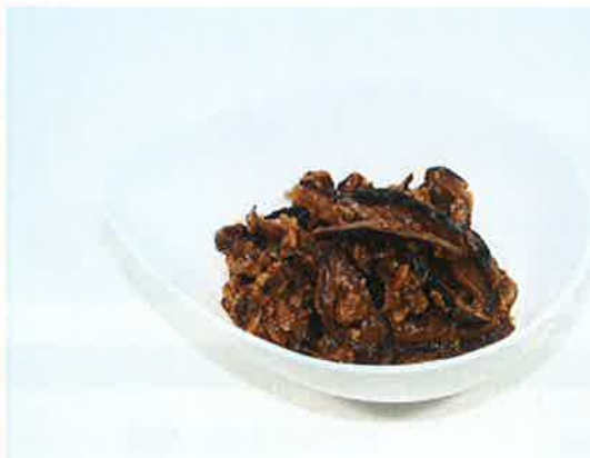
匠のしいたけ肉味噌煮